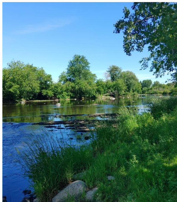
Rivière Yamaska - Farnham 2021

Si vous êtes intéressé(e) à vous présenter comme administrateur/ administratrice, informez-nous d'avance de votre intention par écrit : administration@obv-yamaska.qc.ca